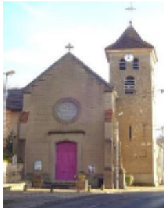
Eg. St Thibault Mandres-les-Rose