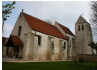
Eg. St Julien de Brioude Marolles-en-Brie