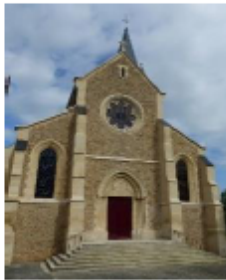
Eg. St Germain d'Auxerre Santeney